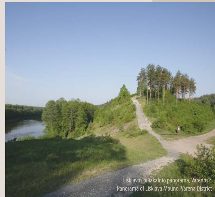
Liškiavos piliakalnio panorama, Varenos r. Panorama of Liškiava Mound, Varena District