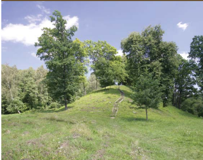
Karmazinių piliakalnis prie Dūkštos upės, Vilniaus r. Karmazina Mound by the Dūkšta River, Vilnius District