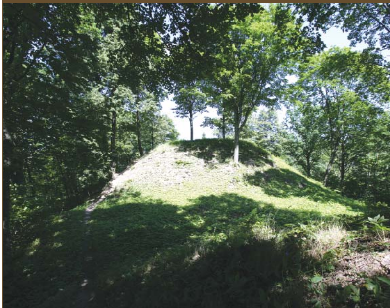
Buivydų piliakalnis Neries regioniniame parke, Vilniaus r. Buivydai Mound in Neris Regional Park, Vilnius District