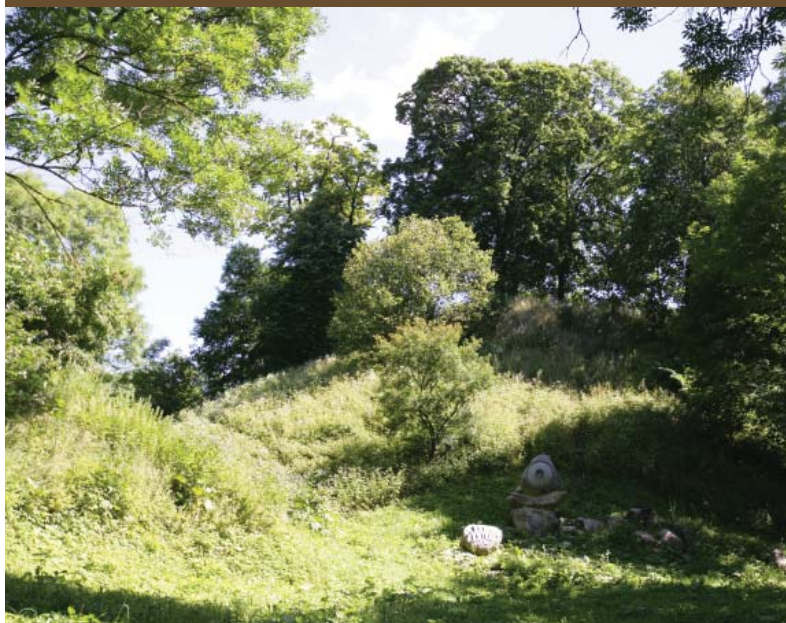
Piliakalnis Maišiagalos dvaro sodyboje, Vilniaus r. Mound on grounds of Maišiagala manor, Vilnius District